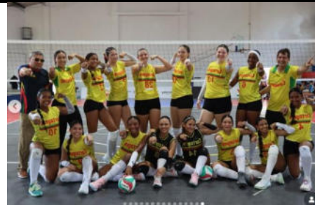
Campeonato Nacional de Menores Femenino de Voleibol.