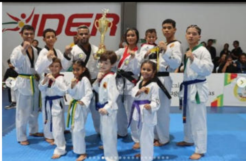
Clásico del Caribe de Artes Marciales