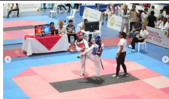
Grand Slam 2025