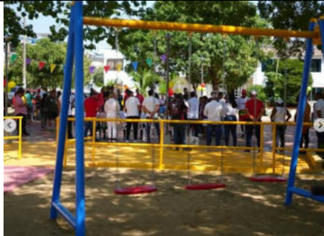
En San Pedro, parque totalmente renovado