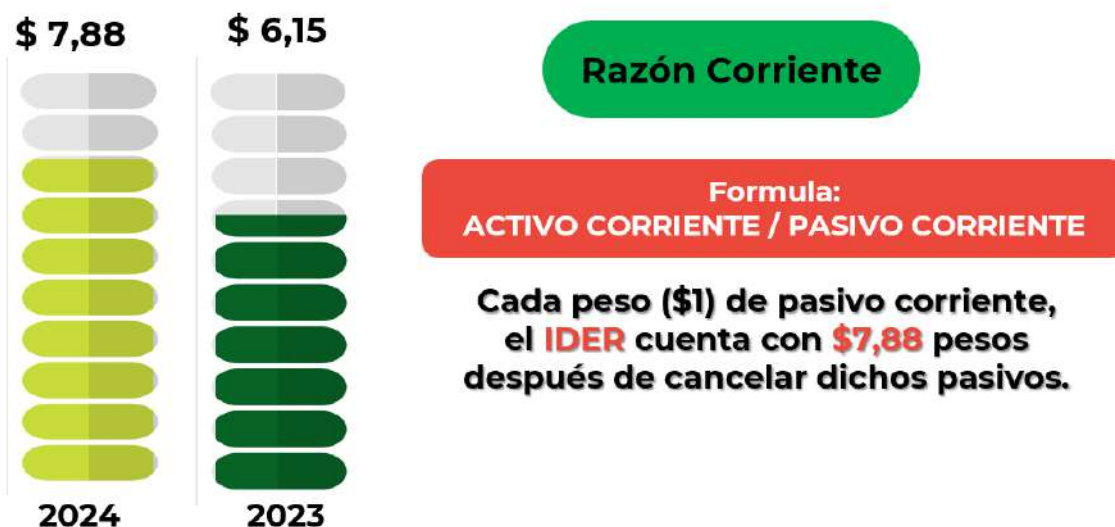
Ilustración 1. Gráfica Razón Corriente