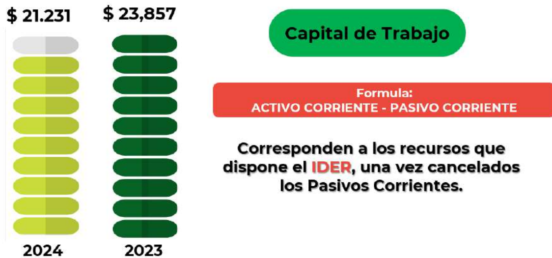
Ilustración 3. Gráfica Capital de Trabajo