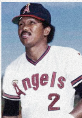
Orlando “El Ñato” Ramírez

En el atletismo con Campo Elías Gutiérrez (q.e.p.d.), Cartagena tuvo un referente en los seleccionados colombianos. Durante los años 30s, se coronó campeón nacional de lanzamiento de jabalina y disco, además de actuar en las carreras de 100 y 200 metros planos. Representó a Colombia en los Juegos Olímpicos de Berlín en 1936, acompañado del velocista cartagenero José Domingo “Perro” Sánchez (q.e.p.d.) y del saltador barranquillero Francisco Del Vecchio (q.e.p.d.) convirtiéndose en los primeros costeños en una justa olímpica.