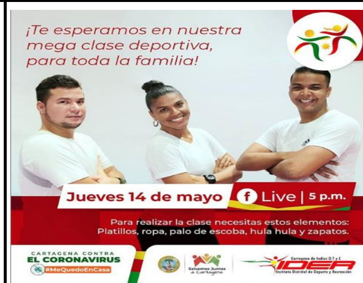
Mega Clase Deportiva para toda la familia, Estrategia Actívate en Casa