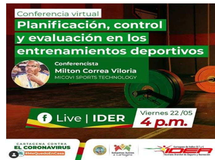
Conferencia Virtual para transferencia de conocimiento en el sector deportivo