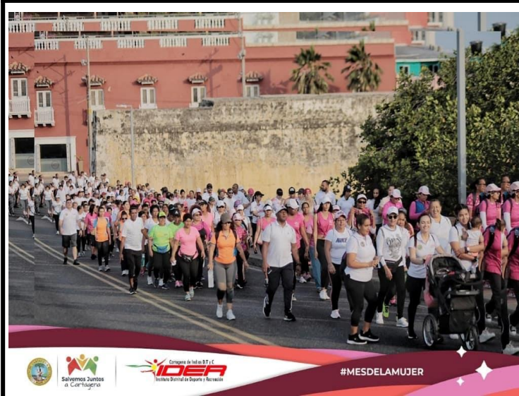
Caminata en conmemoración del día Internacional de la Mujer