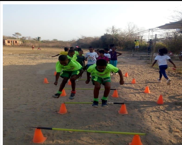
Actividad en Núcleo de la Escuela Iniciación y Formación Deportiva