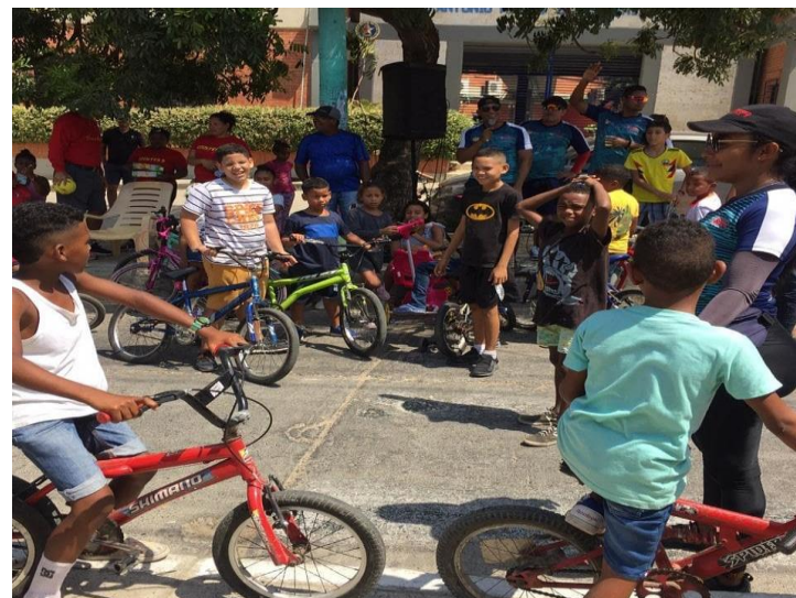
Actividad de Recreación Comunitaria – Vías Recreativas