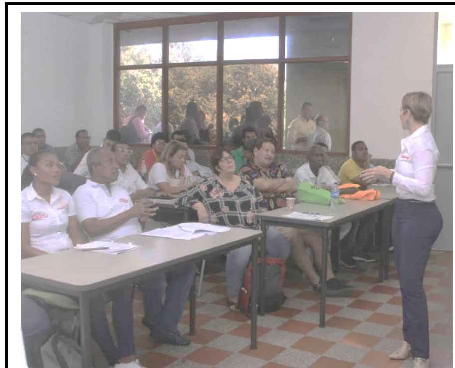
Mesa del Sector Deporte para la Construcción del Plan de Desarrollo Distrital, 18 de febrero.