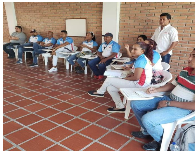
Capacitación dirigida a profesores del área Recreación