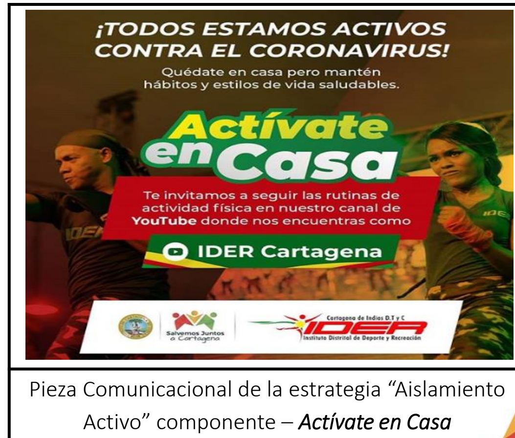
Pieza Comunicacional de la estrategia “Aislamiento Activo” componente – Actívate en Casa

Dada la emergencia sanitaria, se creó la estrategia “Aislamiento activo” y su componente “ACTÍVATE EN CASA” con el propósito de articular desde la comunicación y plataformas digitales, diferentes actividades desarrolladas por las áreas de deporte, recreación y las demás del Instituto.