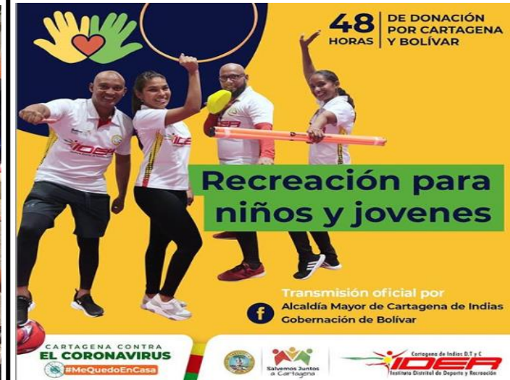
Actividad virtual de recreación comunitaria.