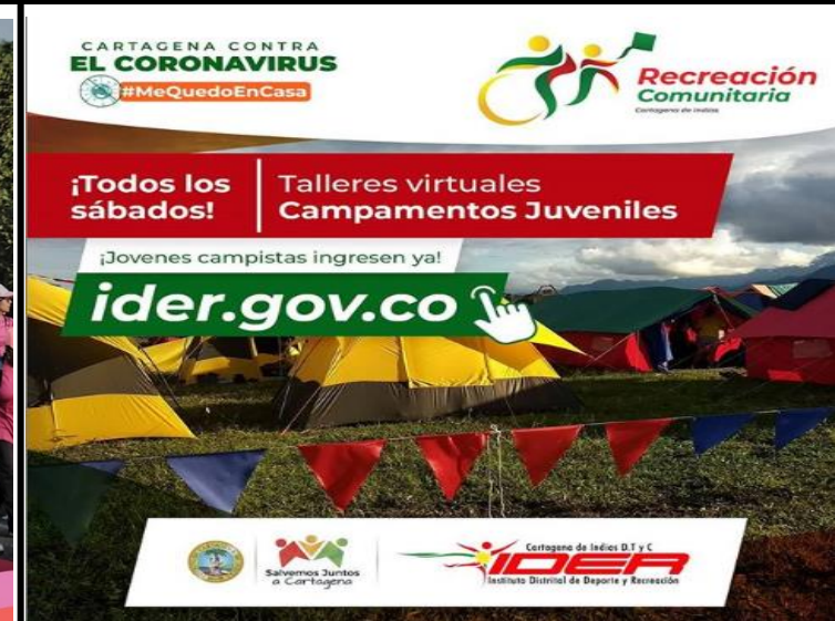
Talleres Virtuales de Campamentos Juveniles