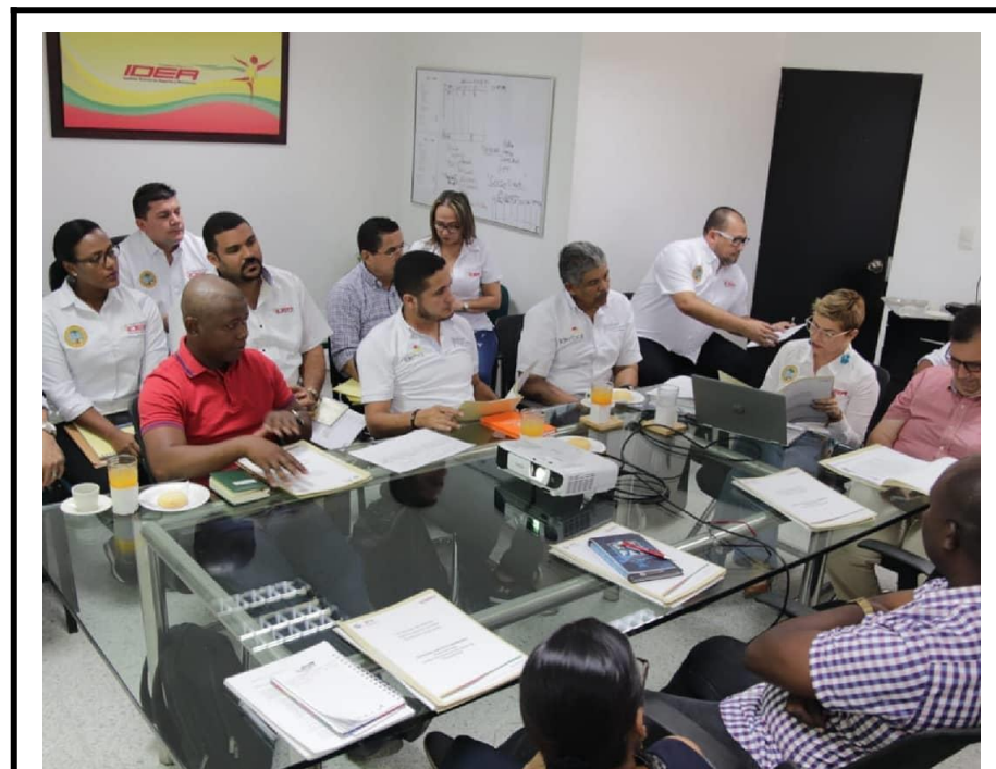
Reunión de la junta directiva, realizada el 14 de febrero 2020